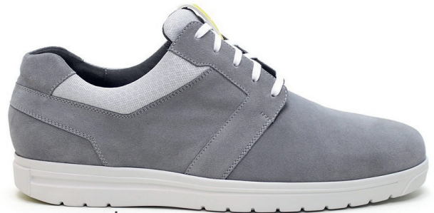
1503.8459 Licht grijs