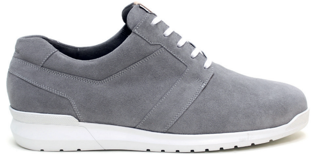
1502.8451 Licht grijs