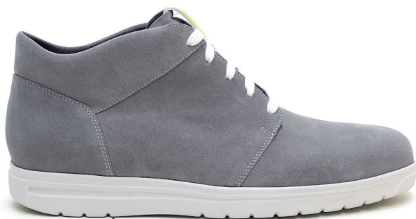
1505.7736 Licht grijs